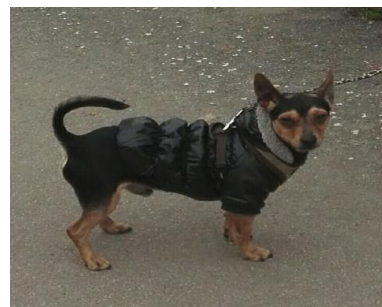
Lucky, aime se reposer à la maison et est fan de Jazz