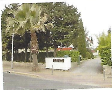
Entrée et parking

Maison d'accueil pour familles de personnes hospitalisées