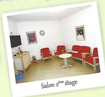
Salon 2 ème étage