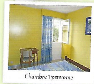
Chambre 1 personne