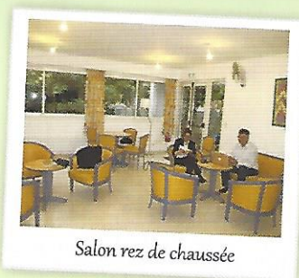
Salon rez de chaussée