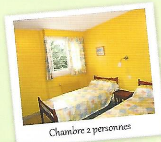
Chambre 2 personnes