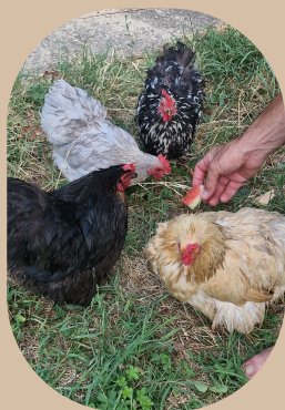
la compagnie des poulettes