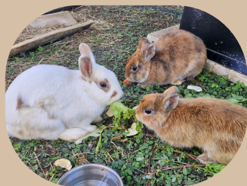
Mona, Blaise et Little les lapins nains