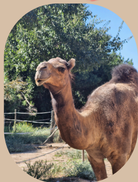
Kashaf le dromadaire