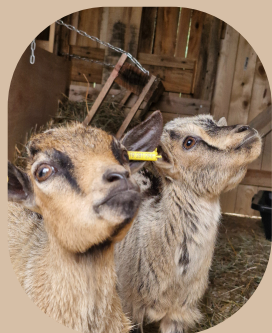
Vassili et Vulcain les boucs nains